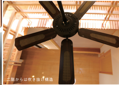
二階からは吹き抜け構造