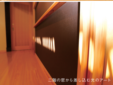
二階の窓から差し込む光のアート