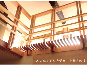
木のぬくもりを活かした職人の技