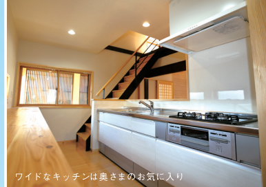
ワイドなキッチンはおさまのお気に入り