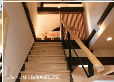
二階へと続く階段も親切設計