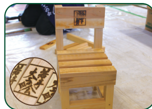
完成した椅子には若手大工の会の焼印入り!