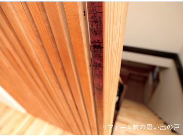
リビング前の思い出の戸