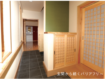
玄関から続くバリアフリー

きつかけは 1冊の広報誌からでした。 想いを 建てる。 南アルプス市若手大工の会 有限会社 小林建築所 造ったのは、想い出に包まれるあたらしい毎日です。 バリアフリーだから、心も通うあたらしい家。 お任せください。みんながこの土地で育った職人です。