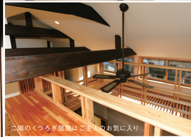
二階のくつろぎ部屋はご主人のお気に入り