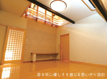
至る所に優しさを感じる思いやり設計