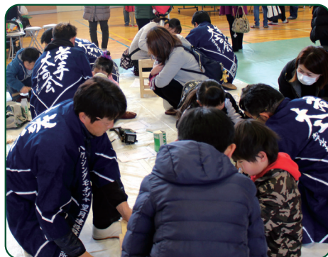
用意した椅子は30脚! あっというまに無くなりました!

2018年2月25日に若草生涯学習センターで行われ市民活動フェスタに若手大工の会も参加しました。昨年は上棟式を行いました、今年は椅子作りに挑戦してもらい、トンカチやドライバーなどを使用し、一から組み立てる作業を行い、物作りの難しさや楽しさを体験してもらいました。小さなお子さまからご年配さんまで、幅広い年代に参加して頂き、大盛況のうちに終わりました。子供たちは初めてながらも一生懸命に取り組み、トンカチやドライバーにも臆する事なく、それぞれが真剣なまなざしで最後まで諦めないで椅子を完成させました。ひと仕事やりとげた子供たちの顔には自身がみなぎり、誇らしげな顔で自分の作った椅子を眺めていました。まさに職人の顔になった瞬間でした。