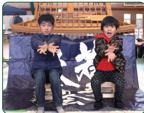
最後は決めポーズ! 椅子作りは楽しかったかな?