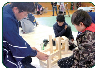
もうすぐ椅子の完成! あとひと踏ん張り!