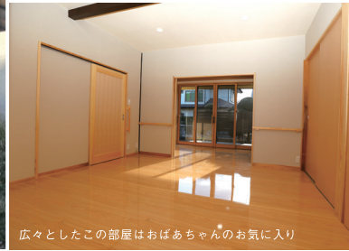
広々としたこの部屋はおばあちゃんのお気に入り