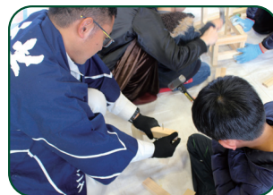
トンカチもへっちゃら! ちびっ子大工の誕生!